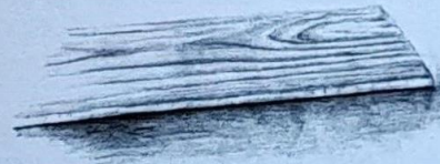
Ein Stück Holz

Hochinteressant ist das Studium von Architekturformen und Gebäuden wie dem Pantheon in Rom, bei dem phantasievoll ein Obelisk und ein Tempel mit Kuppeldach und Dreiecksformen kombiniert sind. Welche Kräfte strahlen aus einem Gebäude aus? Wie wirkt Architektur auf das menschliche Erleben? Welche Einflüsse üben hohe Formen im Verhältnis zu niedrigen Formen auf das menschliche Gemüt aus?