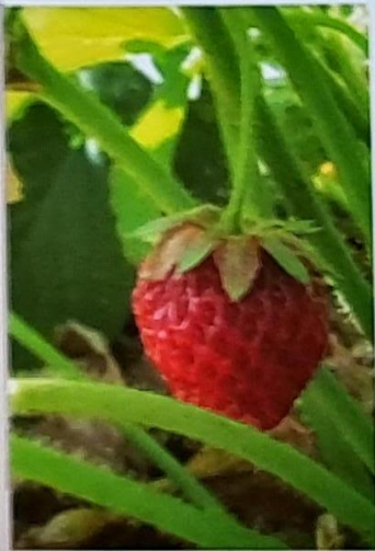
Die Erdbeere, eine beschauliche Frucht

Querschnitt durch die Erdbeere: Der Äther nimmt die Form einer zentrifugalen Bewegung von innen bis an die Peripherie an, an der sich kleine Lichtkreise bilden.