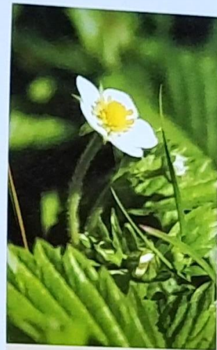
Die liebliche und gleichermaßen würdevolle Blüte der Walderdbeere